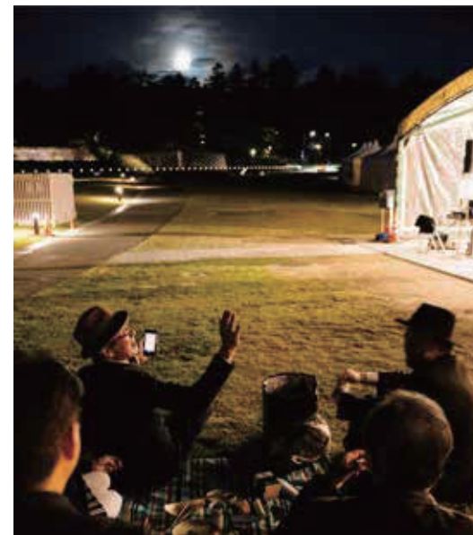
▼チーム対抗の「魅せる工芸ピクニック」美しい!

▼前夜祭工芸ピクニック@しいのき迎賓館 は、器と一品持ち寄りパターン。特別にお借りした工芸家のうつわに盛りつけ。月が綺麗でした。