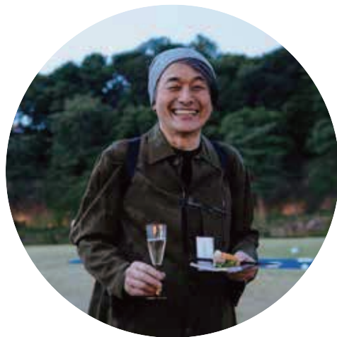
振り返り視聴ゲスト |