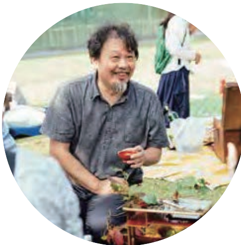
振り返り視聴ゲスト |